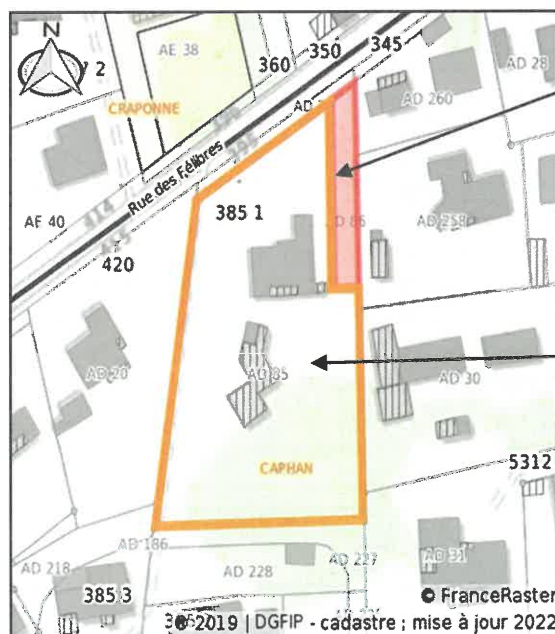
PARCELLE AD 86 204 m 2