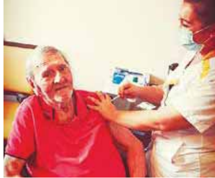
Les résidents de la maison de retraite Korian la Rimandière ayant donné leur accord ont reçu la 1 re injection du vaccin (voir page 6)