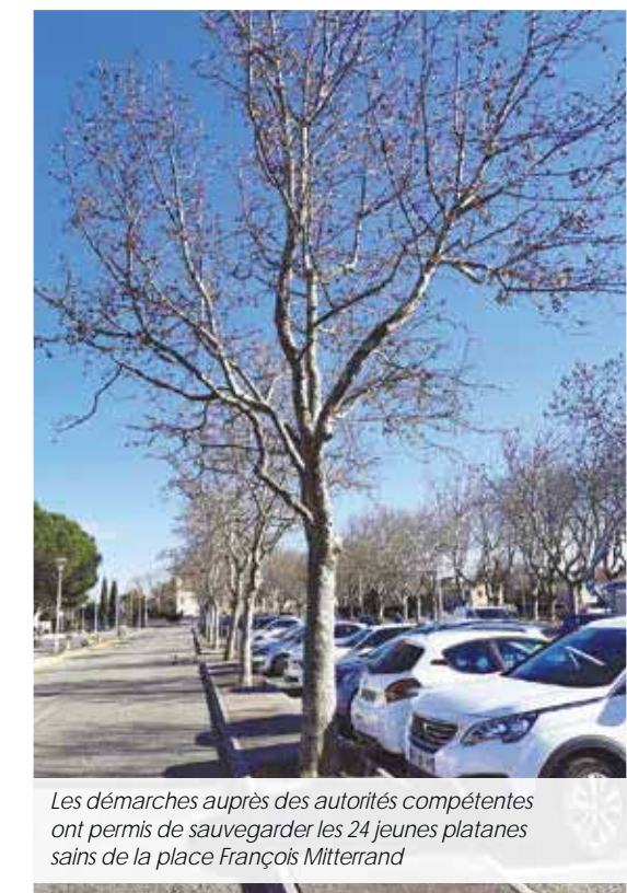
Les démarches auprès des autorités compétentes ont permis de sauvegarder les 24 jeunes platanes sains de la place François Mitterrand

Plusieurs options sont étudiées, en mono ou multi-essences. Les critères recherchés sont nombreux : arbres résistant aussi bien aux sols secs qu'aux chaleurs ou aux gels intenses, économes en eau, ne perdant pas leurs feuilles, ayant un système racinaire adapté au milieu urbain... La décision sera prise dans les prochaines semaines pour une plantation cet automne, la saison la plus favorable pour replanter.