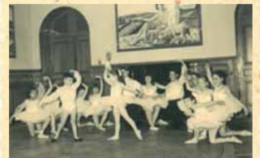
Danse classique en 1957, dans la salle d'Honneur