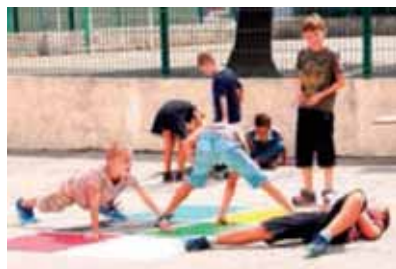
Les jeux au sol seront redessinés dans toutes les cours d'écoles

Municipale et les associations cyclotouristes de la ville. Plus largement, il est important de donner aux jeunes le goût du sport. Ce dernier apporte des bases et valeurs fondamentales telles que l'appropriation de son corps, la confiance, l'estime de soi... Apprendre à nager, à courir, à faire la pirouette avant font également partie des enseignements cruciaux, propices au bon développement de l'enfant". Il est aussi possible de faire du sport en s'amusant. Aussi, dans la cour de l'école élémentaire Marcel Pagnol, tous les tracés des jeux au sol ont été redessinés et revalorisés par des jeunes de l'ADDAP13, dans le cadre d'un chantier d'insertion. Cette initiative, qui s'inscrit dans le programme des actions de "Vivons en Forme" (voir page 5) sera reproduite dans tous les autres groupes scolaires.