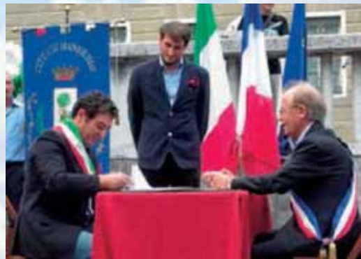
Lors de la signature de la Charte de Jumelage à Manerbio

Quelques mots sur Manerbio - Cette ville de 13 000 habitants est située en Lombardie, au sud du lac de Garde dans la Province de Brescia (entre Milan et Venise). Tout comme Saint-Martin, elle conserve un caractère rural, avec d'importantes activités agricoles et d'élevage (exploitations de porcs et de bovins avec notamment la bufflonne, dont une fameuse mozzarella porte le nom). Le tertiaire y est également présent. Plusieurs manifestations ponctuent la vie locale : Fête des associations, carnaval, Fête patronale, festivals de musique, accueil de l'étape d'une course de vieilles voitures de collections... Enfin, un petit clin d'œil original : il y a 120 ans, l'usine de la Dynamite était ouverte avec des personnes venues d'Italie. A Manerbio, ce sont des Français qui étaient à l'origine de la création d'une manufacture de filature.