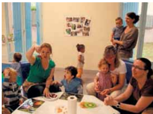
Lors de l'atelier "brochettes de fruits" du RAM

L'un des projets phares était l'organisation de deux conférences interactives sur l'alimentation (pour les écoliers) et l'eau