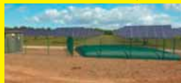
Photomontage représentant le projet

Le projet de centrale photovoltaïque au sol dans le secteur de la Dynamite, porté par Solaire Direct, nécessite une mise en compatibilité du document d'urbanisme. Afin d'expliquer cette procédure aux Saint-Martinois et leur présenter les caractéristiques du projet, une réunion publique sera organisée le mercredi 14 octobre à 18h, salle AQUI SIAN BÈN.