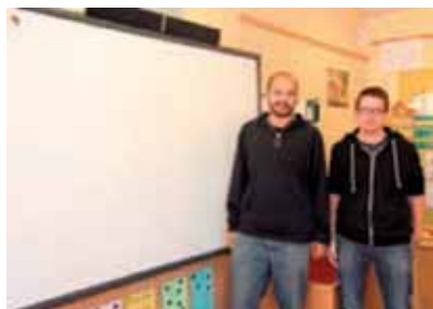
L'équipe pédagogique de la CLIS devant le tableau blanc numérique

nouvel outil pédagogique : un tableau blanc numérique. Intuitif et interactif, il permet aux enfants d'apprendre de manière ludique. Dans un premier temps, il sera surtout utilisé par les élèves de la classe pour l'inclusion scolaire (CLIS). En outre, comme les petits Saint-Martinois, le WiFi a fait sa rentrée dans les groupes scolaires de la commune. Aussi, les changements dus aux évolutions technologiques ont lancé une nouvelle réflexion concernant les outils pédagogiques du futur et l'apport du numérique dans l'enseignement.