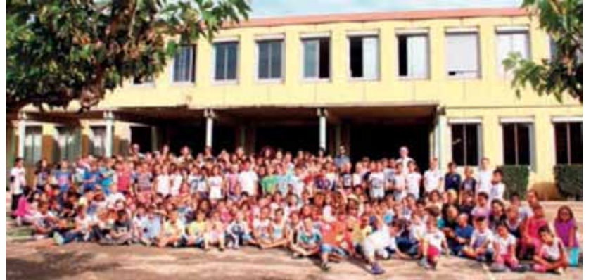
Dans le groupe scolaire du Lion d'Or, deux classes supplémentaires ont été ouvertes

La rentrée 2015-2016 s'est effectuée de manière sereine pour les 1 440 écoliers (états) nouvelle année, la seconde depuis la mise en application de la réforme des rythmes. De nouveaux outils pédagogiques à disposition des enseignants, de même que certaines convergent vers un même point, une même finalité : l'épanouissement des je