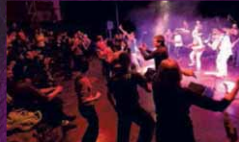
Lors du dernier concert de l'ONB au CDC, en janvier 2012

Samedi 17 octobre à 21h, après un premier passage mémorable en 2012, l'Orchestre National de Barbès (ONB) revient sur la scène du Galet. Avec le concert de Michael Jones (voir page 8), cette soirée est l'un des moments phares du début de la saison culturelle du Centre de Développement Culturel (CDC).