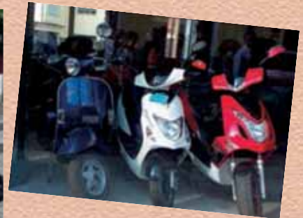
De nombreuses vitrines italiennes étaient décorées aux couleurs de la France