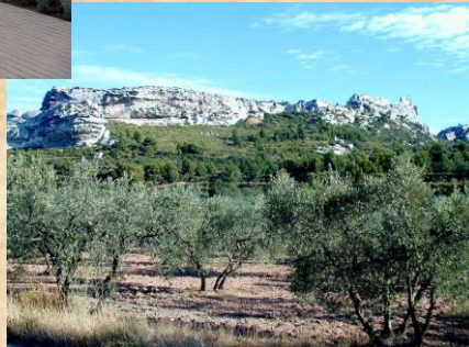
Oliveraie dans les Alpilles