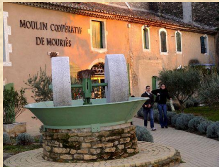
Moulin à huile