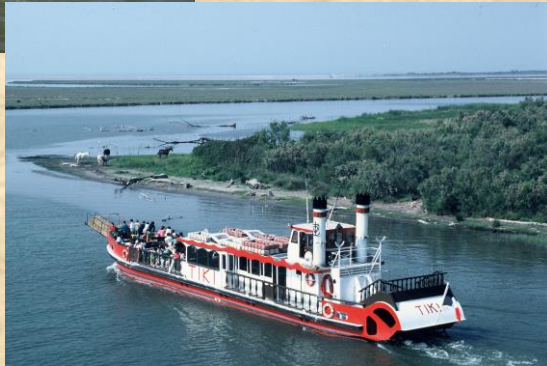
Bateau sur le Petit Rhône

Imprimé par la Mairie de St-Martin-de-Crau