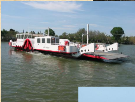
Bac de Barcarin