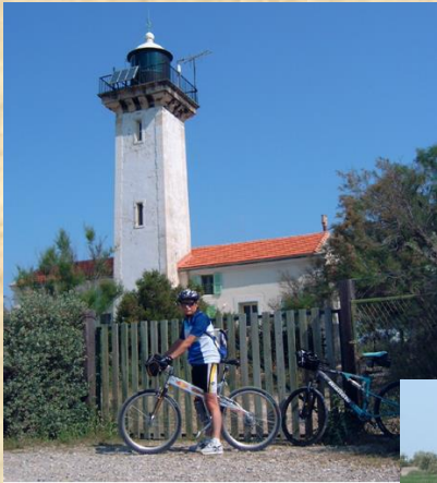
Phare de la Gacholle