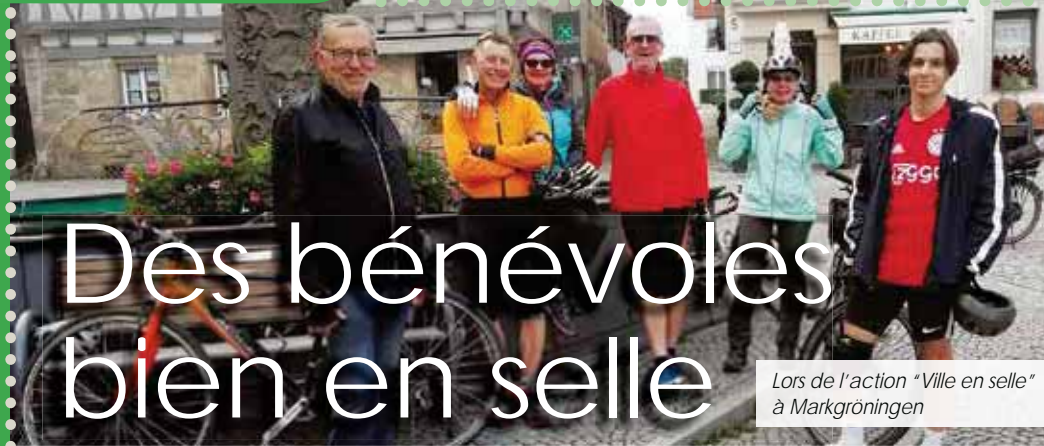
Lors de l'action "Ville en selle" à Markgröningen

Cet été, plusieurs bénévoles se sont lancés deux défis de taille, relevés avec brio. Le premier, "La Ville en selle", a été réalisé à l'initiative de l'association de jumelage Saint-Martin de Crau/Markgröningen. Plusieurs licenciés du Rayon d'Or de la Crau (ROC) y ont pris part. Le second, "Toulouse, toutes à vélo" a permis à quatre cyclistes féminines du ROC d'entreprendre un voyage itinérant vers cette destination.