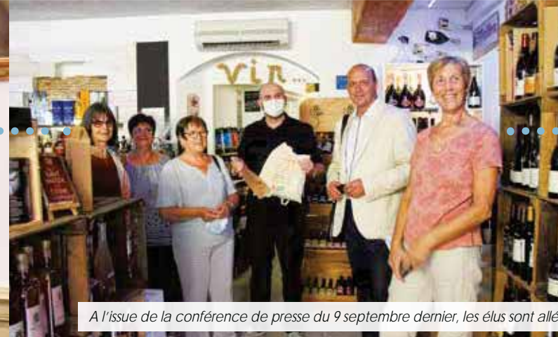
A l'issue de la conférence de presse du 9 septembre dernier, les élus sont allés à la rencontre de deux commerçants bénéficiaires du Fonds de relance ACCM.