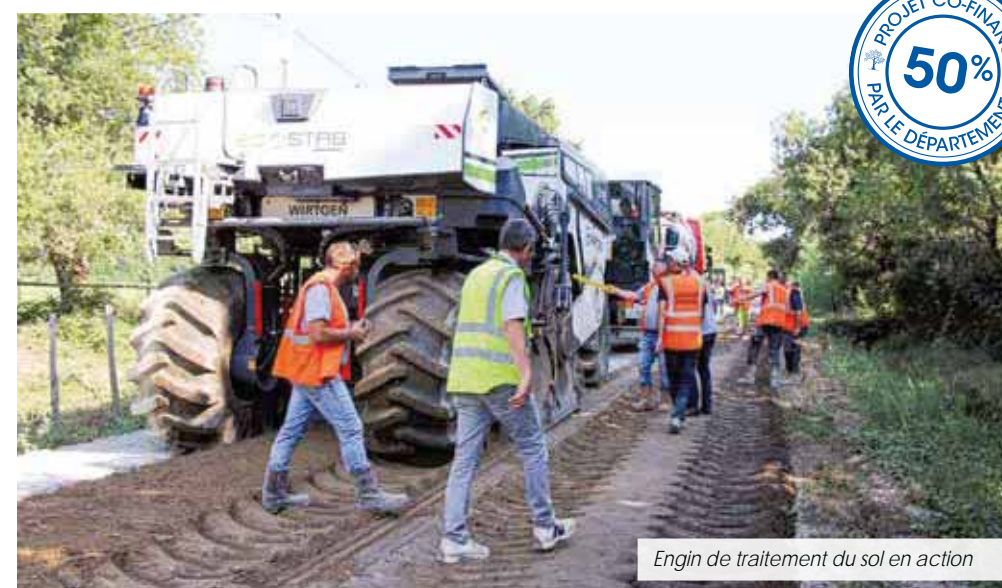
Engin de traitement du sol en action

La technique employée par l'entreprise Braja Vésigné pour traiter les déformations de chaussée consiste à utiliser un matériau de chaussée concassé et traité in situ, à froid, avec une émulsion de bitume ou une mousse de bitume, assimilable à un retraitement en place. Ce procédé écologique innovant mélange les couches supérieures de la chaussée, sur des épaisseurs de 12,5 cm à 30 cm, pour recréer une assise de chaussée renforcée, homogène et durable. Les travaux de la voie communale n° 17 se sont déroulés sous la surveillance du laboratoire routier de l'entreprise. Ce dernier procédera à un contrôle régulier de la voie durant plusieurs années afin d'évaluer la tenue de route et la stabilité de la structure.