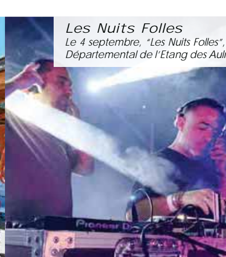
Les Nuits Folles Le 4 septembre, "Les Nuits Folles", une soirée électro proposée par l'association Kolybree, a eu lieu dans le cadre enchanteur du Domaine Départemental de l'Etang des Aulnes.