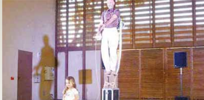
Spectacle "La Valise" Le 28 août, la série de spectacles estivaux gratuits du CDC s'est clôturée sous la Grande Halle avec une création de la Cie Ezeq Le Floc'h.