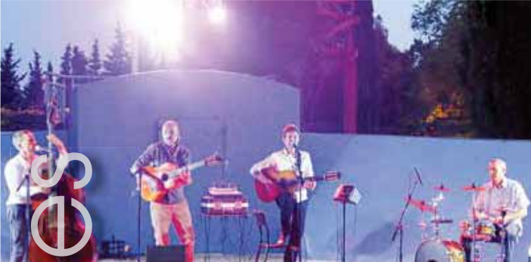
Concert de Cash Misère Le 25 août, ce groupe, qui proposait un répertoire de chansons françaises, s'est produit au Jardin Public dans le cadre du Festival Cartes Postales.