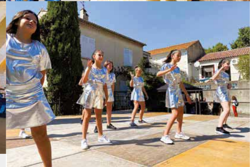
Fiest'Assos Samedi 11 septembre, la Fiest'Assos s'est déroulée dans une ambiance estivale, festive et conviviale. Au détour des stands, démonstrations et scènes ouvertes, le public, venu en nombre, a pu découvrir un large aperçu des activités proposées par les associations saint-martinoises pour la saison 2021-2022.