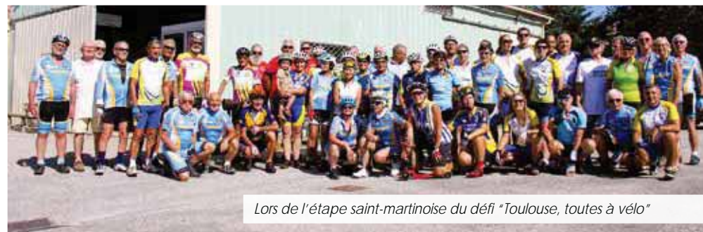
Lors de l'étape saint-martinoise du défi "Toulouse, toutes à vélo"

En juillet, le club de jumelage Saint-Martin de Crau/Markgröningen a invité le Rayon d'Or de la Crau à se joindre à l'action "La Ville en selle". Créée en 2008, elle est organisée chaque année en Allemagne pour sensibiliser à l'environnement. Notre ville jumelle y participe depuis deux ans. L'objectif consiste à parcourir un maximum de kilomètres à vélo sur une période imposée de 21 jours. La distance totale effectuée est ensuite convertie en kilomètres carbone afin d'encourager les usagers à utiliser plus fréquemment les modes de déplacements doux dans leur quotidien. A l'issue des performances, les chiffres sont sans appel. La "Team Jumelage", composée de 45 cyclistes, a parcouru 15 620 km. Sur un même trajet, une voiture aurait rejeté de 2,296 tonnes de CO 2 . L'équipe comptait 25 Saint-Martinois, dont des membres du ROC, qui ont réalisé à eux seuls 5 924 km. Grâce à ces