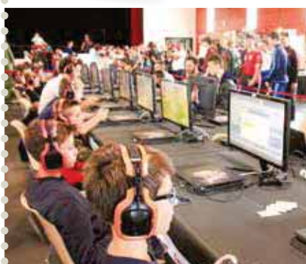
Rendez-vous les 16 et 17 octobre pour le Salon du Jeu Vidéo

A l'heure où nous écrivons ce numéro, les mesures gouvernementales qui s'appliqueront en octobre restent incertaines. Pour vous tenir informés, vous pouvez consulter les publications régulièrement mises en ligne sur le site Internet, l'application mobile ou la page Facebook de la Ville et écouter la radio Soleil Fm. Notez-le ! L'obligation du port du masque ou du passe sanitaire dépend des directives préfectorales.