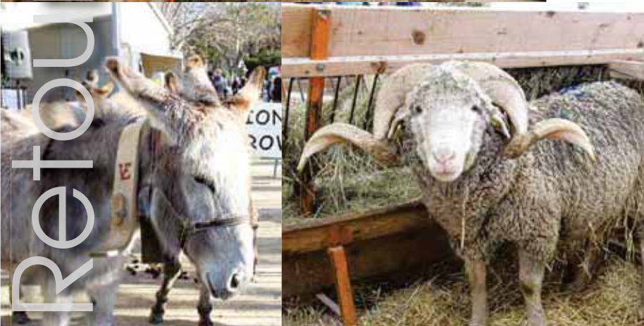
Foire Agricole de la Saint-Valentin Eleveurs, producteurs et visiteurs ont une nouvelle fois répondu présents pour cette 39 e édition, qui s'est déroulée le mercredi 10 février au Foirail. Au regard du contexte actuel, l'événement a certes été moins dense que les autres années, mais tout aussi convivial et chaleureux.