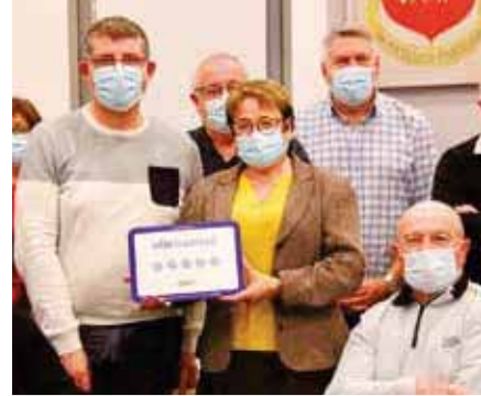
Pour la 3 e année consécutive, la Ville a reçu le label 5@, plus haute distinction en matière de politique numérique. (voir page 6)