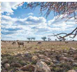
Une sortie en Crau est organisée le samedi 19 décembre

A l'heure où nous écrivons ce numéro, les mesures gouvernementales qui s'appliqueront à compter du 1 er décembre ne sont pas encore connues. Les informations relatives à la crise sanitaire, présentées dans ces pages, pourraient ainsi ne plus être d'actualité au moment où vous recevrez ce journal. Pour rester informés, n'hésitez pas à consulter les publications régulièrement mises en ligne sur le site Internet et la page Facebook de la ville et à écouter la radio Soleil Fm (voir page 16). Par ailleurs, si vous n'avez pas accès aux réseaux, il est encore possible de vous faire connaître via le coupon-réponse de la page 6.