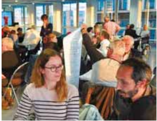
Nicaya Conseil, spécialisé dans le domaine de la participation citoyenne, animera la concertation publique autour du contournement autoroutier.