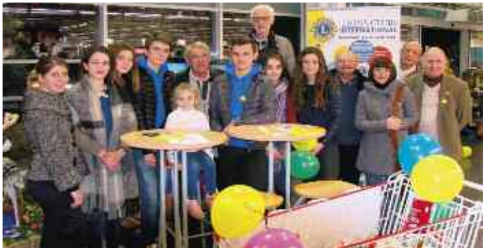
L'opération Caddithon, organisée par le Lion's Club en collaboration avec le Lycée Saint-Charles, a permis de récolter 2 418 €. Et, cerise sur le gâteau, les 2 caddies remplis de victuailles ont été offerts aux Restos du Cœur par les gagnants.

La somme définitive des fonds récoltés, arrêtée au 31 janvier, sera communiquée sur le site Internet de la ville.