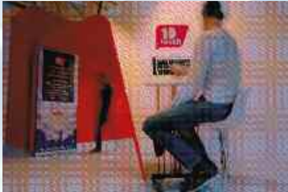
Le dispositif tactile 1D Touch sera installé à la Médiathèque, du 2 février au 30 mars